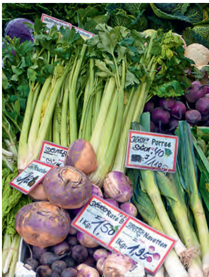
Sellerie, Steckrüben, Rettich, Pastinaken, Petersilienwurzeln, Lauch und Fenchel gehören zu den Herbstgemüsen.