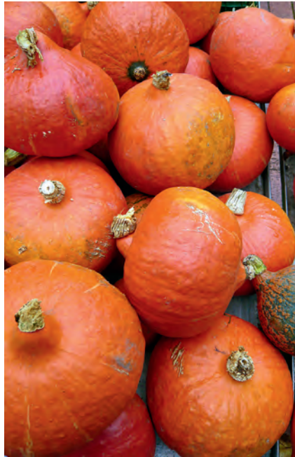
Der Hokkaidokürbis stammt von der japanischen Insel Hokkaidō und ist eine kleine Form des Riesenkürbis ( Cucurbita maxima ).

Kürbis stärkt das Qi, die Lebensenergie. Seine blutnährende Wirkung unterstützt die Augen bei Sehschwäche, Linsentrübung und Grauem Star.